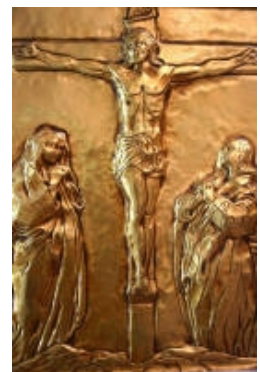
XII° Gesù Cristo crocifisso con la Madonna e San Giovanni