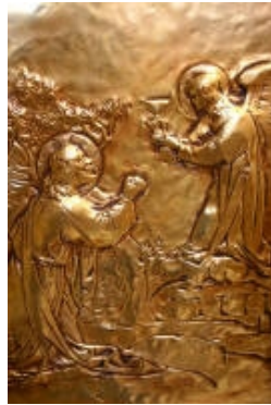
II° Gesù Cristo nell'orto di Gethsemani