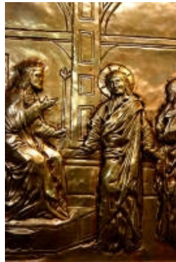
VI° Gesù Cristo condannato a morte