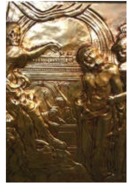
IV° Gesù Cristo davanti a Pilato