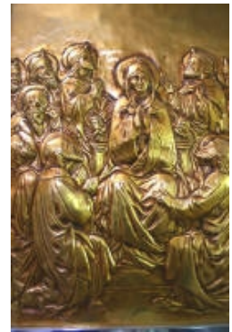
XVI° Discesa dello Spirito Santo sugli apostoli e la Madonna