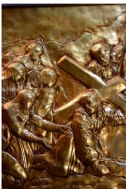
IX° Gesù Cristo consola le pie donne