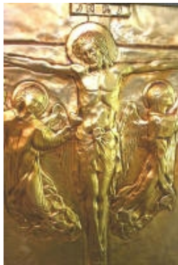
XIII° Gesù Cristo crocifisso