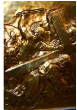
VIII° Gesù Cristo aiutato dal Cireneo a portare la croce