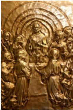
I° Ultima cena

Opera dell'intagliatore prof. Iginò Legnaghi di Verona, docente all'Accademia di Brera in Milano. Le formelle sono in rame bagnate in oro, sbalzate a mano e cesellate. La Via Crucis è stata inaugurata il 13 Gennaio 1992.