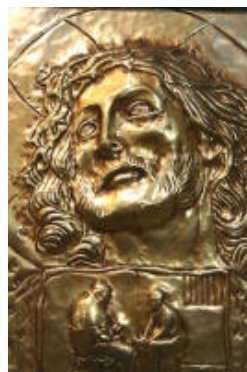
XI° Gesù Cristo e il buon ladrone