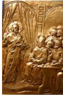
III° Gesù Cristo davanti al Sinedrio