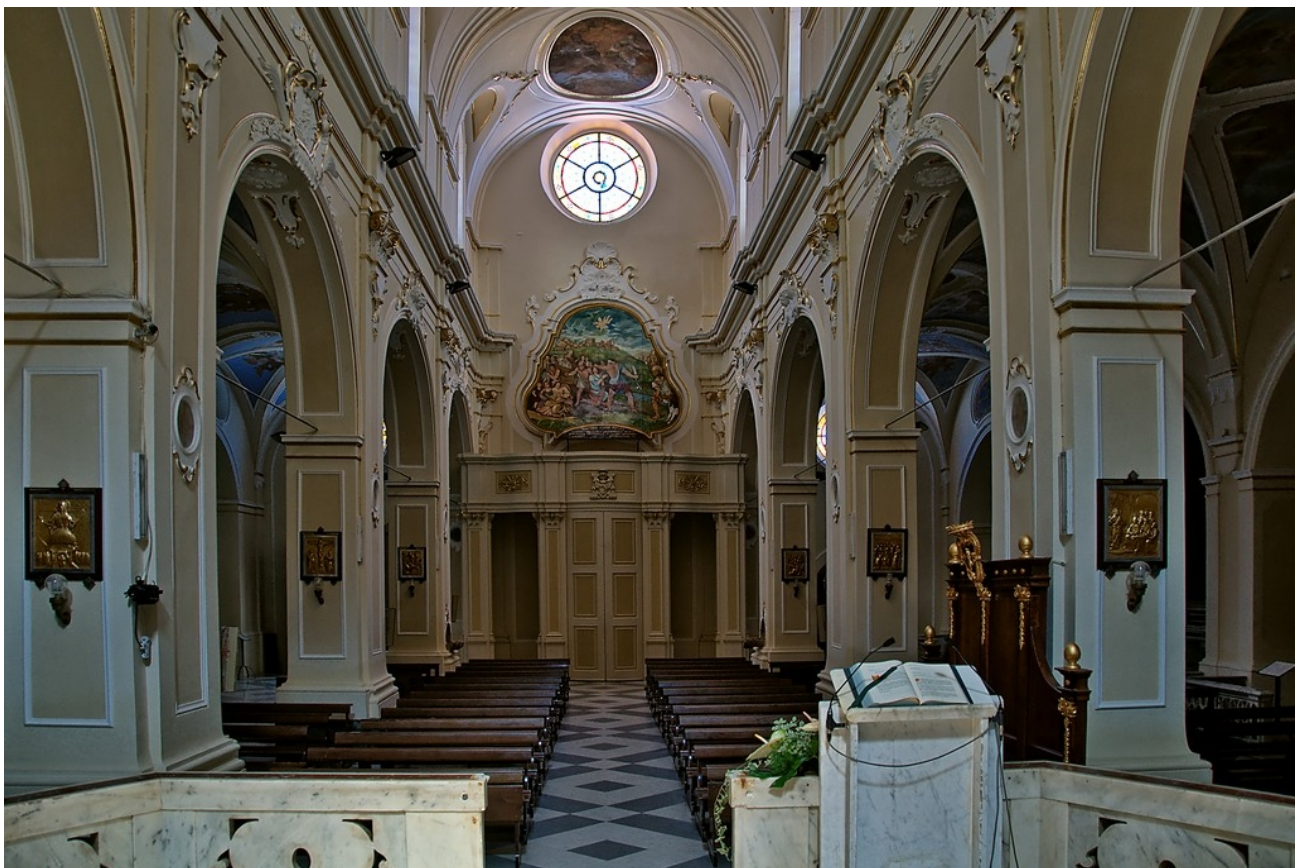
le formelle della Via Crucis disposte nella cattedrale di Ascoli Satriano