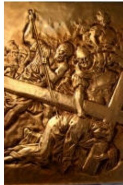
VII° Gesù Cristo cade sotto la croce