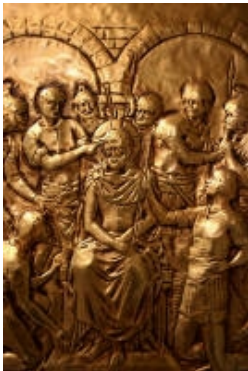
V° Gesù Cristo deriso